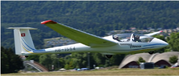
Schleicher ASK-21 (3 Flz.)