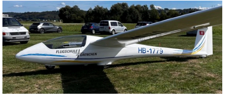
Schleicher ASK-23 (3 Flz.)