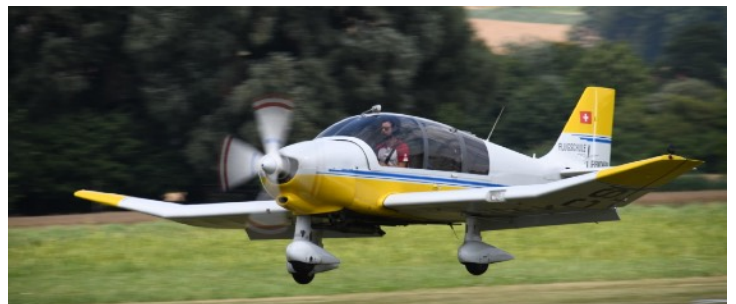
Robin REMO 180 (1 Flz.)