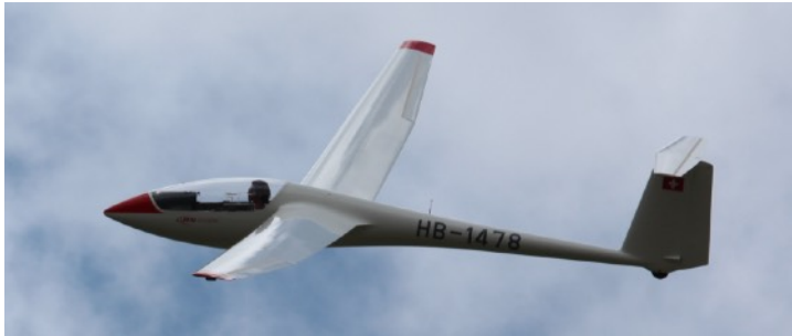
Schleicher ASW-19 (2 Flz.)