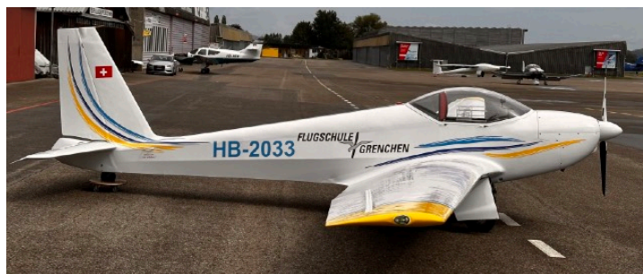
Schleicher ASK-16 (1 Flz.)