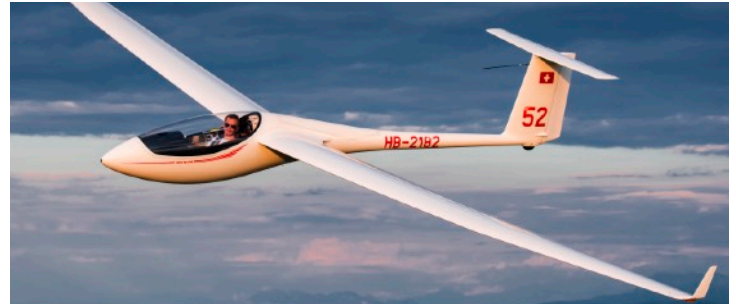
Schleicher ASW-24 (2 Flz.)