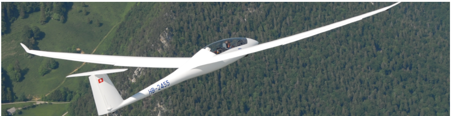
Schempp Hirth Duo Discus mit Hilfsmotor (1 Flz.)