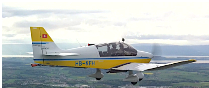
Robin REMO 200 (1 Flz.)