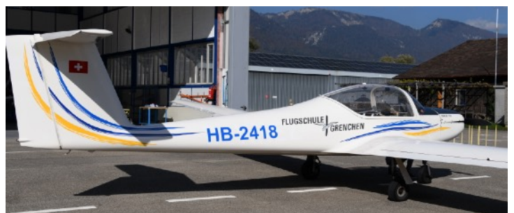
Valentin Taifun 17E